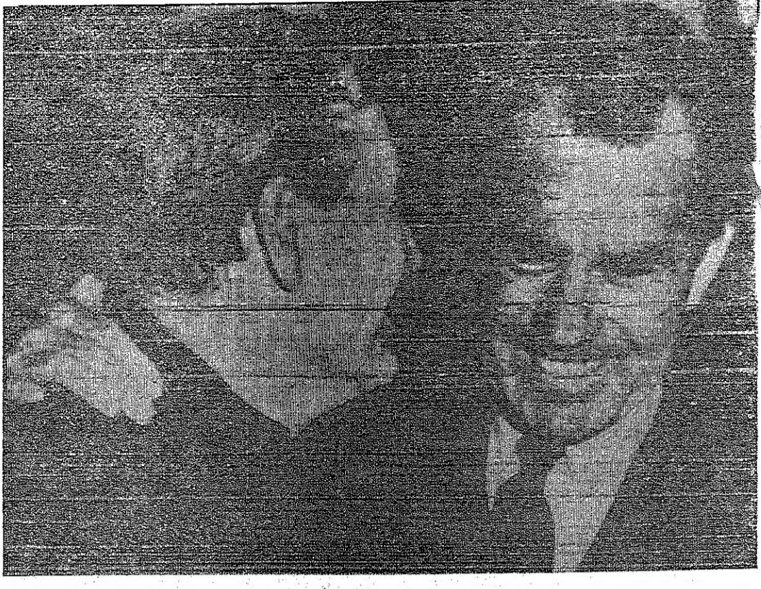
الرئيس المنتخب ريتشارد نيكسون يطرح بزعامة حاكم نيويورك نيلسون روكفلر خلال اجتماعها في تشييع جنازة ارثر سالزبرغر رئيس مجلس ادارة جريدة نيويورك تايمز

ولن تكون ابدأ امنة تماما وسط جميع من يحيطون بها من اعداء . ٣ بواعث وقال سكراتون ان على الولايات المتحدة ان تبذل كل مجهود لتأمين علاقتها مع الدول العربية . وذكر سكراتون بان هناك ثلاثة بواعث لذلك هي : الاول - مصالح امريكا الاقتصادية في تلك البلدان والثاني - حماية نفوذ امريكا في الشرق الاوسط لتحقيق السلام بين العرب واسرائيل والثالث والاخر - ضرورة عدم التزام امريكا جانب اسرائيل القوي استقطبت كل اهتمامها الامر الذي قد يقف بالعرب للارتقاء في احضان الاتحاد السوفياتي وباسرائيل في احضان امريكا . الامر الذي يضر بمصالح جميع الاطراف حرب عالمية واعلن السناتور جورج ايكن في ندوة لتقريبية ان الادارة الجديدة في امريكا ستواجه امكانية حرب عالمية اذا لم تقر سياستها في الشرق الاوسط لان روسيا تمد العرب بالسلح وقد تزودهم ايضا بسلح نووي وامريكا تبيع السلاح لاسرائيل وهذا يخلق توترا خطرا ويجعل الحرب وشيكة .